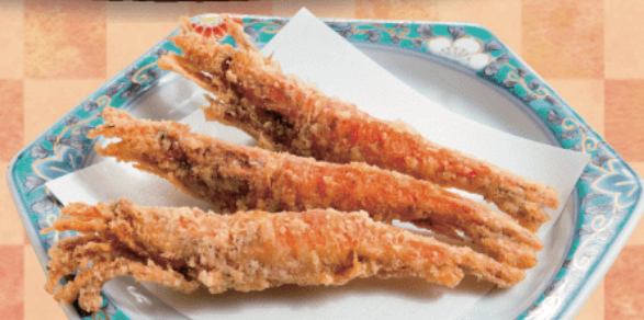
モサエビ (猛者海老) の唐揚げ 3尾