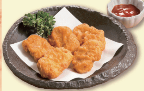
チキンナゲット 5個