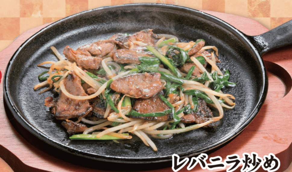
レバニラ炒め 本体価格 700円 (税込770円)