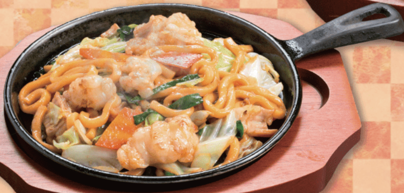
ホルモン焼きうどん