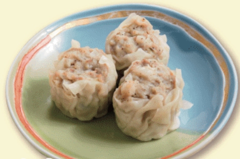
焼売 (シューマイ) 3個