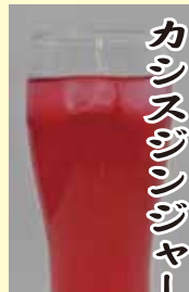
カシスジンジャー