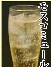
モスクォミュール