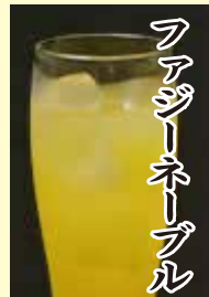
フアッシャーブル