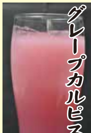
グレープカルピス