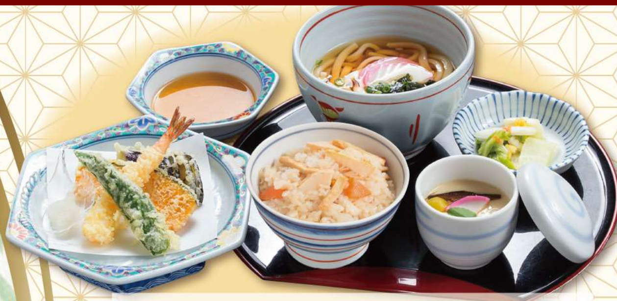
筍ご飯天ぷらセット 本体価格 1,000円 (税1,100円)