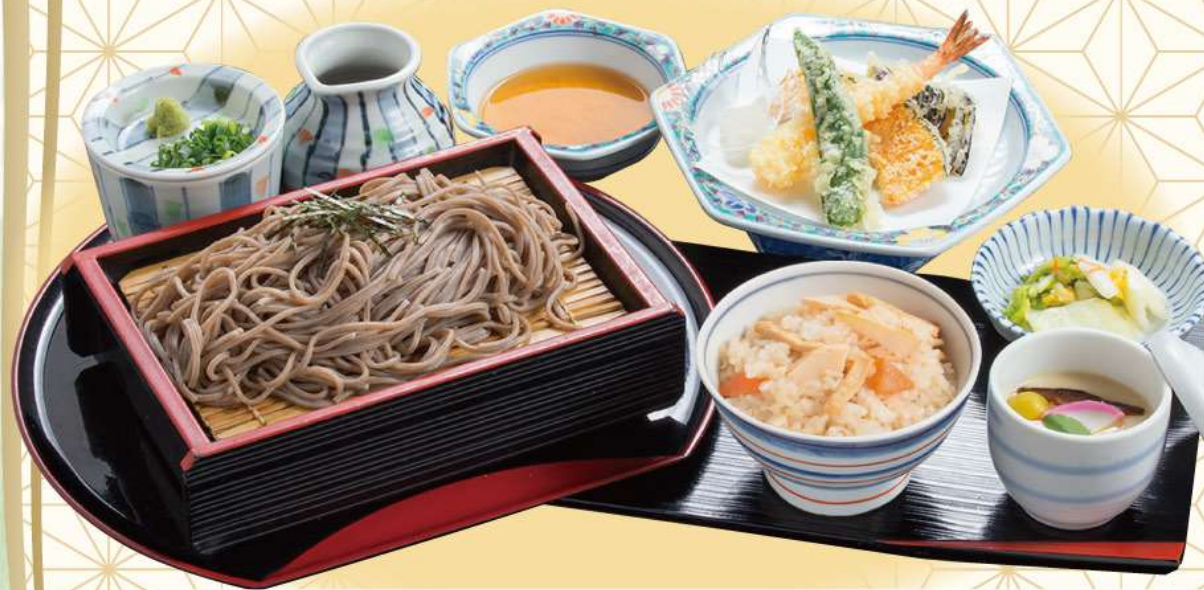
筍ご飯天ざるそばセット 本体価格 1,110円 (税1,221円)